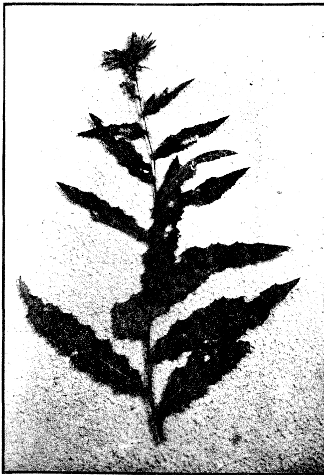
Sl. 3. Vrsta Ptilostemon strictus sa Grmije planine. Species Ptilostemon strictus from the Grmija mountain.

Polazeći od činjenice da je do ovog momenta vrsta Ptilostemon strictus (T en.) W. Greuter figurirala samo u herbarijumima, a tek od 1973. godine i u